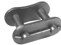
通し"S" Pin (Type TS)