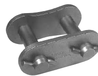
"S" ピン (Type S)