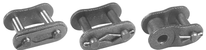
スプリング クリップ (Type Sp CL)