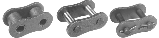
ローラー リンク (Type R/L)